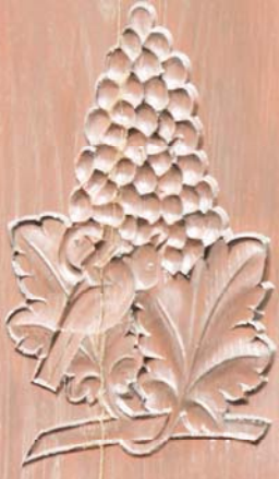
- Offener Keller -